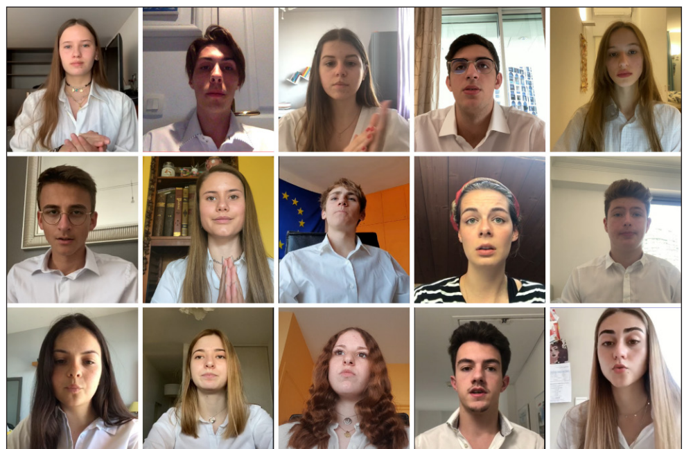
Une partie des élèves du lycée Albert-1 er ont participé à ce projet pour soutenir l'organisme Aleksandr Savchuk Foundation.

Pour voir la vidéo : http://www.aleksandr-savchuk-foundation.org/time-to-stay-at-home/